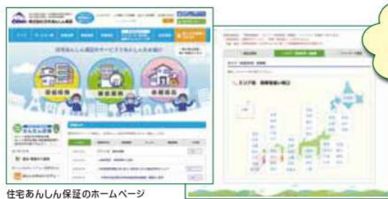
住宅あんしん保証のホームページ

住宅あんしん保証および一般社団法人 住宅瑕疵担保責任保険協会のホームページに、保険に加入できるリフォーム工事業者の会社名、連絡先や保険付保実績等が公表されます。